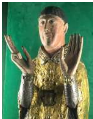
Reliquaire de St Césaire d'Arles

Vous intéressez-vous aux mots particuliers que sont la canonisation, la béatification, voire la sanctification ? Sachez, d'abord, que cela concerne des personnes : un saint, une sainte.