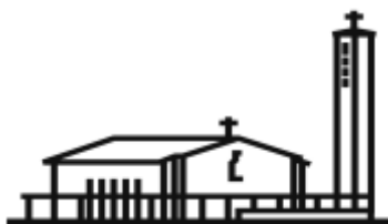
Eglise du CHRIST-ROI Chemin de l'Épargne 6 1213 Petit-Lancy