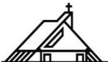
Paroisse SAINT-MARC Courrier et contact : UP Plateau Chemin de l'Épargne 6 1213 Petit-Lancy